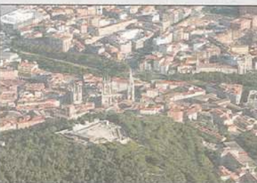
Contempla el túnel en el cerro de San Miguel.

La idea es transformar la BU-11 en una vía urbana, desde su conexión con la ronda interior sur hasta alcanzar la calle Vitoria, templando el tráfico actual y mejorando la entrada a los barrios a sus márgenes. Otra de las iniciativas que contempla es la construcción de un nuevo viario de acceso al Ecoparque de Cortes y a los depósitos de CLH, así reducir el tránsito de vehículos pesados por la cañada de Palazuelas. Apuesta por el cierre del viario sur de Villalonquéjar para descargar de tráfico la calle López Bravo.