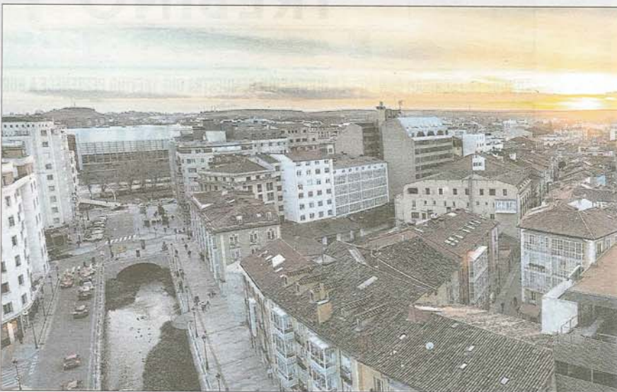
Vista de la ciudad de Burgos, desde el río Vena, a la altura de la calle San Lesmes.