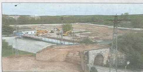
Imagen de los antiguos depósitos de CLH.