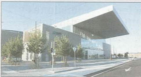
La nueva estación de Renfe Rosa de Lima.

Plantea la extensión de la Universidad en el entorno de San Amaro en lugar de hacia La Milanera. Se aprovechará la cercanía del Hospital del Rey y del Bulevar en esa ampliación. Adicionalmente, en la ficha del suelo urbano no consolidado de La Milanera existirá una vinculación a la comunidad universitaria de los usos que se materializarán, incluida la previsión de apartamentos para universitarios y una nueva residencia.