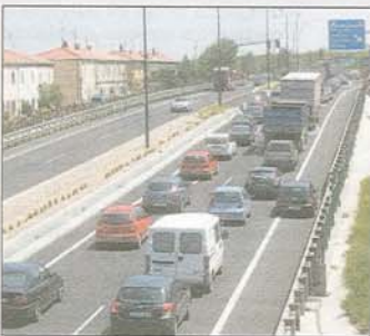
Pretende reducir el tráfico de la BU-11. / I.L.M.